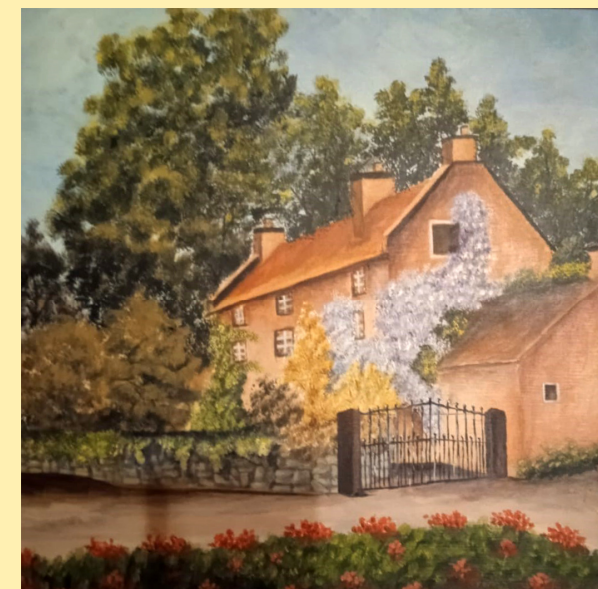
Campagna inglese - acrilico su tela, 40 x 40