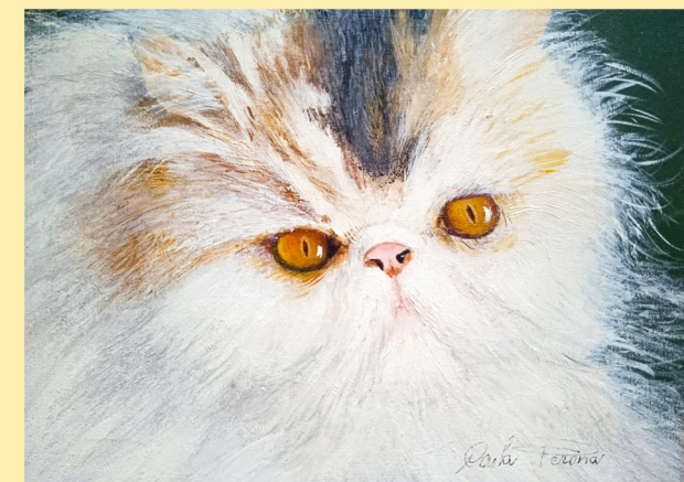
Anastasia - acrilico su tela, 35 x 25

Inaugurazione Sabato 16/9/2023 ore 18,00