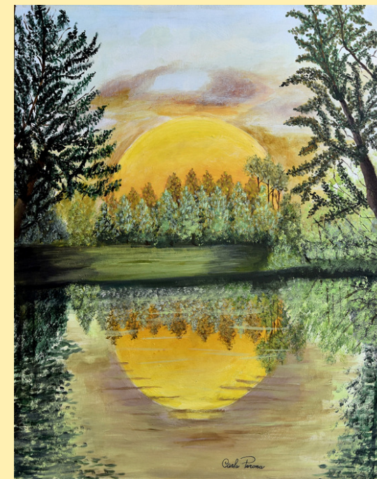
Aurora sul Po - acrilico su tela, 50 x 60