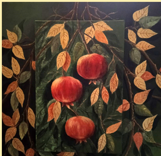
Melegrane - acrilico su tela, 40 x 40

Carla Perona incarna sempre il frutto delle sue passioni tramite l'ausilio della pittura, quasi come se noi osservatori dall'esterno potessimo sentire l'essenza profonda di quelle atmosfere che hanno stimolato l'autrice a rappresentarlo.