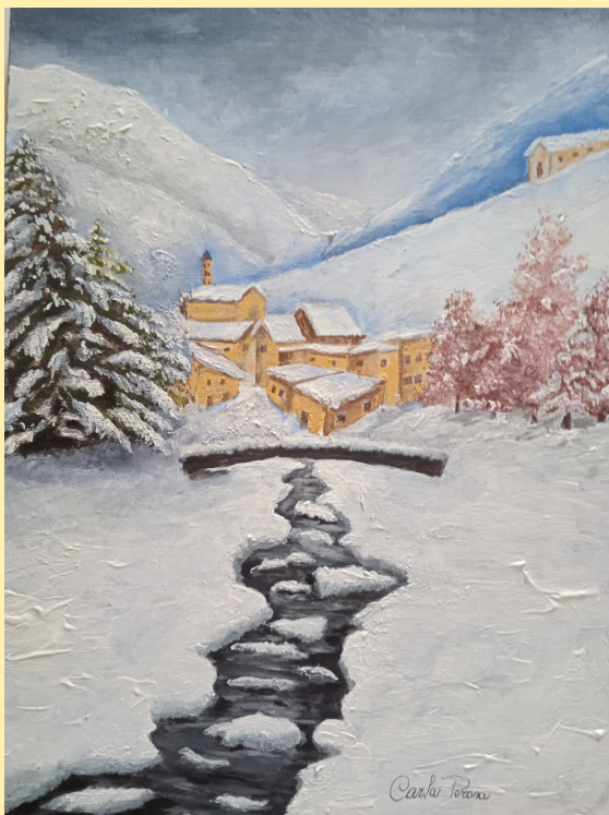
Inverno - acrilico su tela, 30 x 40