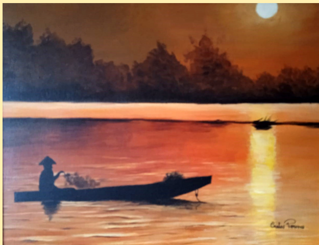
Tramonto sul Mekong - acrilico su tela, 30 x 40

Carla Perona Studio e Abitazione Corso Francia, 169, Torino Tel. 3387128055