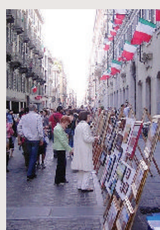
La scorsa edizione

➔ L'Associazione Italian Art in the World organizza domenica 15 aprile «Lagrange - La Rue des Artistes - La Via degli Artisti», quarta mostra collettiva di arti visive all'aperto che vedrà la partecipazione di cento artisti provenienti da tutta Italia. I partecipanti alla manifestazione esporranno le loro opere lungo via Lagrange, nell'area pedonale, dalle ore 9 del mattino e fino alle ore 19. La manifestazione ha il patrocinio di Regione, Provincia e Circonscrizione 1. Informazioni 011/4531915.